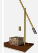
01-04 - PODSTAVEC