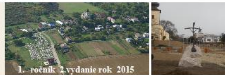
1. ročník 2. vydanie rok 2015

Obec Nižný Hrušov Nižný Hrušov 520 09422 Nižný Hrušov tel. 057/4493200 0905945299